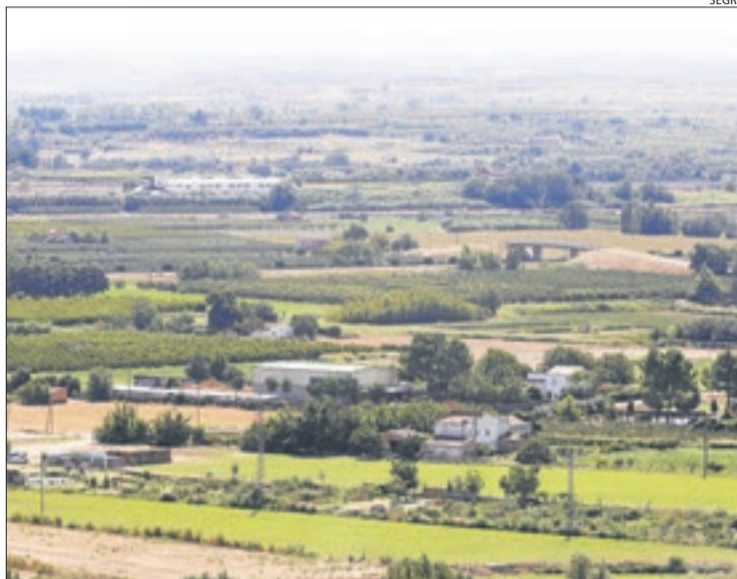
Vista aèria de l'Horta de Lleida.

D'altra banda, apunta que l'Horta es troba en un moment