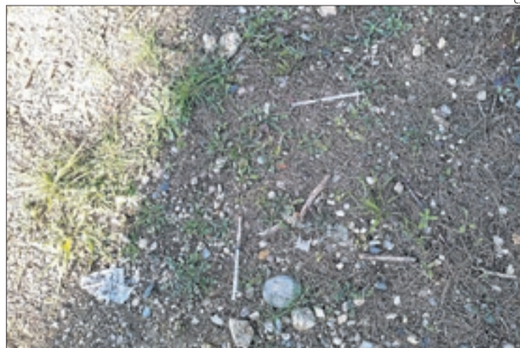
Algunes de les xeringues trobades a Gardeny.

Per això, anuncia que a la propera comissió d'Urbanisme en sol·licitaran la neteja i manteniment. "Tant els representants